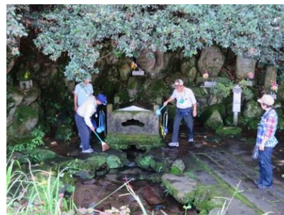
10年ほど前に訪れ清掃活動を行った時は、水量が減っていた。

この水の水質は、硬度36・pH6.6であり、昭和の全国名水百選に選定されている。また「とやまの名水」である。（岡岸喜義 記）