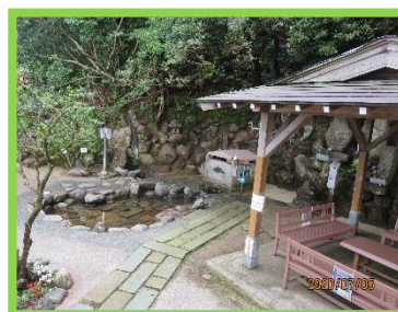
新たな湧水口発見により 令和2年4月に水量を復活させ、整備された。