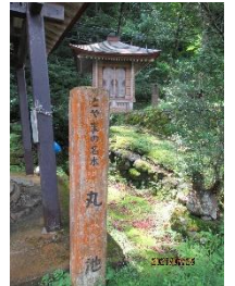
丸い蓋の中を覗いてみると、きれいな水が湧き出していた。