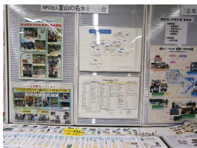
高岡ウイング・ウイング祭展示