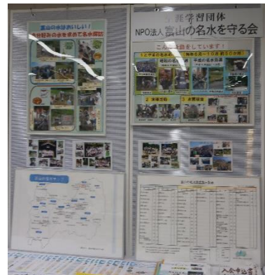
ウイング・ウイング祭展示